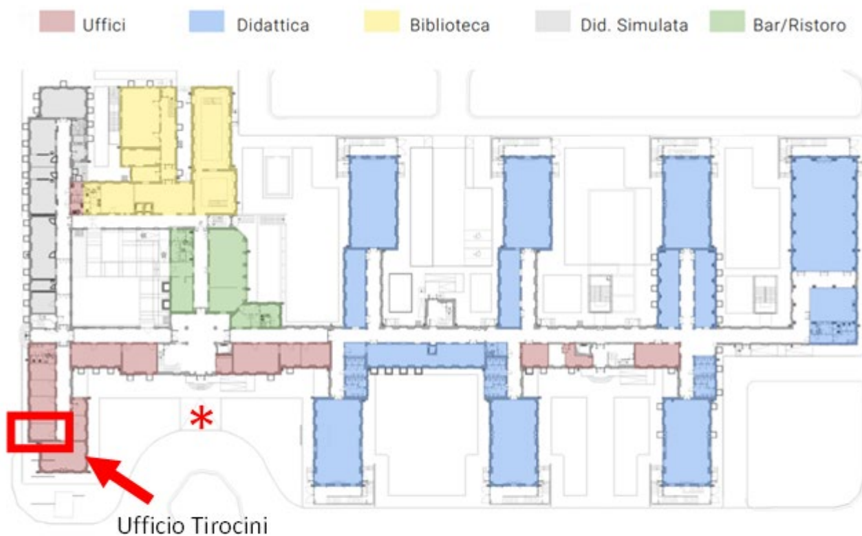
Pianta del piano rialzato del Campus della Salute.

* Ingresso principale del Campus della Salute